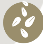
GRANOS DE SÉSAMO