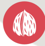
FRUTOS DE CÁSCARA